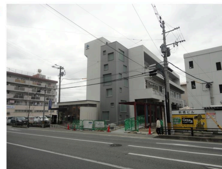
▲完成に向けて工事進行中です。