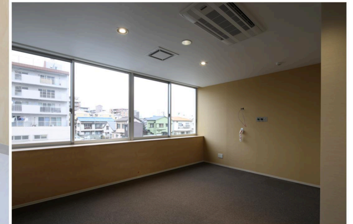
▲新規2階談話スペース ▲新規入院室

建物概要 所在地：福岡県福岡市東区菅松2丁目24-11 用途：有床診療所（19床） 発注者：有限会社恵寿会 設計者：株式会社青木茂建築工房 施工者：株式会社北洋建設 竣工：2014年2月 構造：RC造 階数：地上3階 延べ面積：998.09㎡