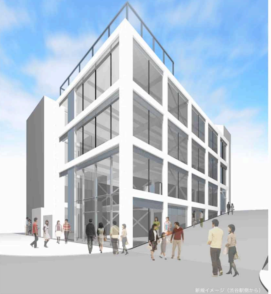
新規イメージ（渋谷駅側から）

《参加申込書》 回答先：FAX 03-5789-0489または メール tokyo@aokou.jp 回答期日：3月1日（木）