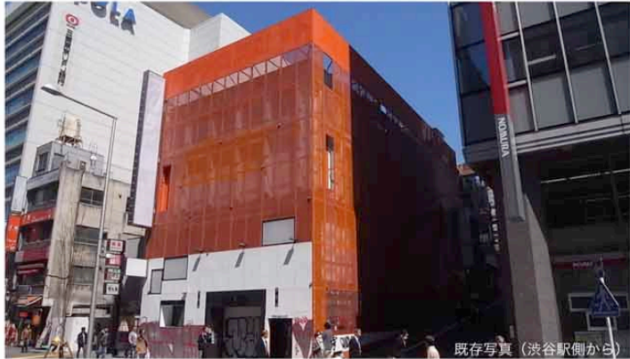
既存写真（渋谷駅側から）