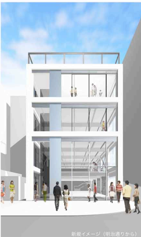
新規イメージ（明治通りから）

所在地：東京都渋谷区渋谷1丁目15-1 発注者：三徳建物株式会社 設計者：株式会社青木茂建築工房（構造：構造計画プラス・ワン/電気：Eos plus/機械：ymo） 施工者：株式会社イチケン 竣工：2012年3月 構造・規模：S造 地上4階 延べ面積：824.43m 2 → 858.00m 2 用途：遊技場 → 物販店、飲食店