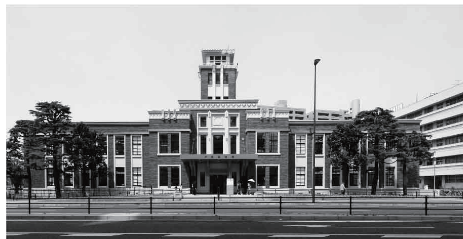
リファイニング建築の戸畑図書館

同図書館は、昭和8年に竣工した旧戸畑区役所庁舎を、耐震補強などをして図書館へと用途替えした。当時の優雅な外観保存を前提に、建物内部のみで耐震補強し、中廊下の柱、梁桁に絡み補強などをしている。