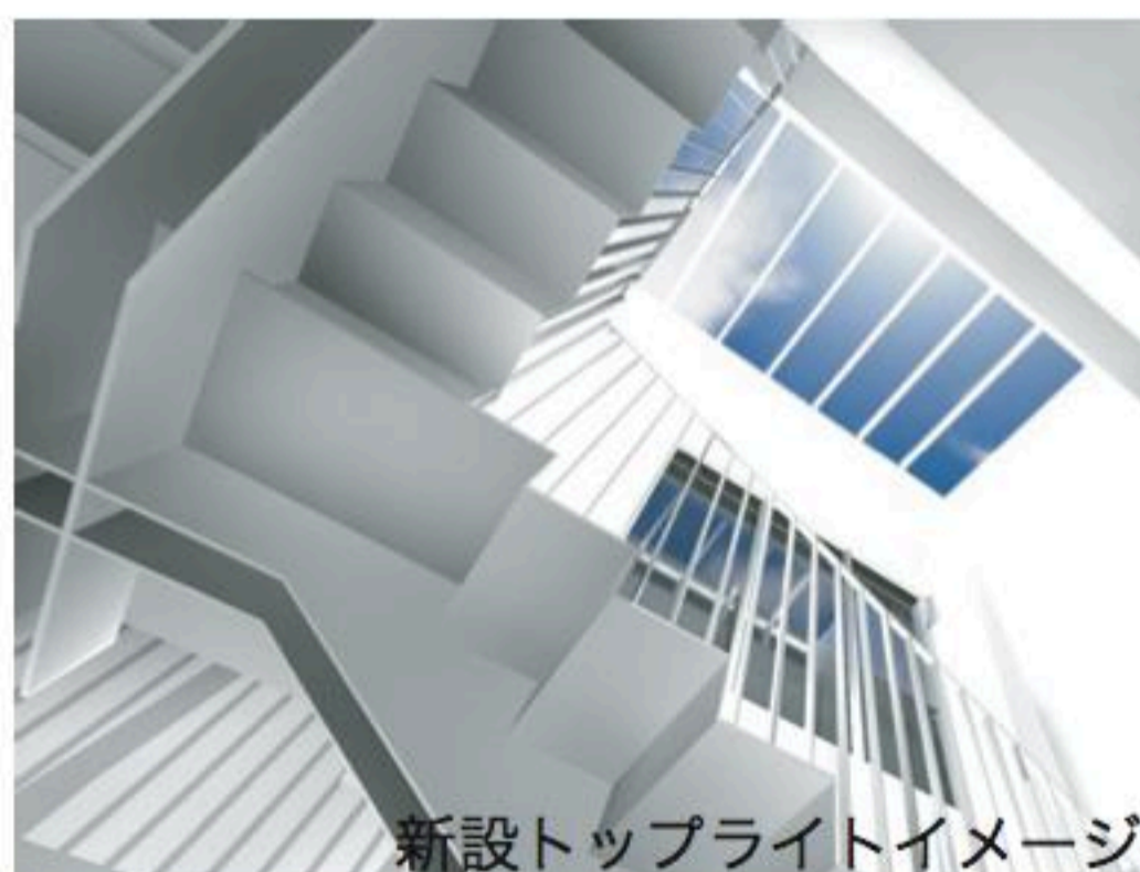
新設トップライトイメージ

所在地 : 山口県下関市みもすそ川町 3-75 用途 : 旅館 発注者 : 下関市 設計者 : 株式会社青木茂建築工房 施工者 : 長野・永山 JV (建築)、山陽電気(電気)、空調サービス(空調)、新ホーム・日環特殊 JV (給排水) 竣工 : 2011年12月 オープン時期 : 2012年2月予定 構造 : RC造・一部S造 階数 : 地下1階・地上2階 延べ面積 : 1,831.94m 2