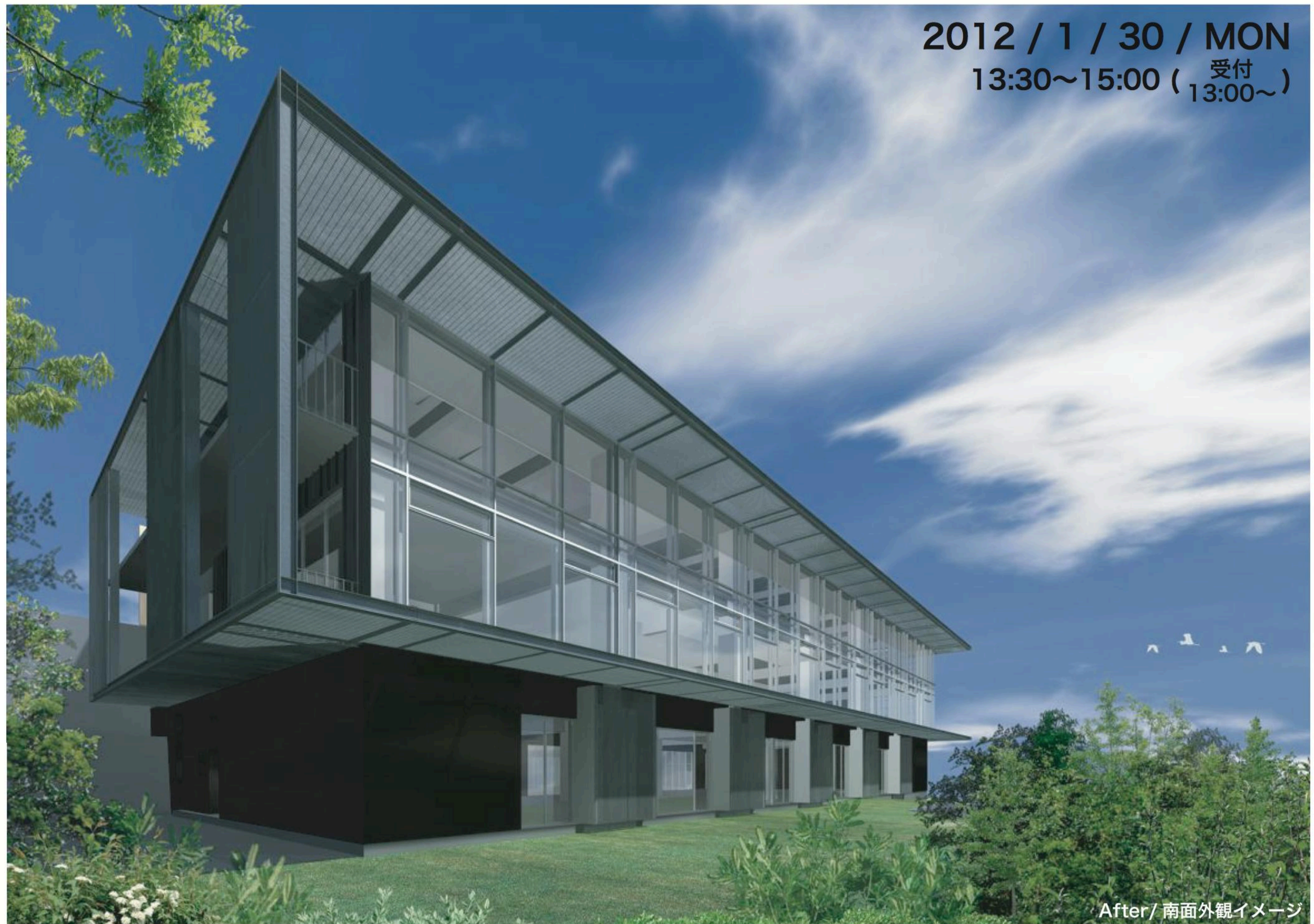
After/ 南面外観イメージ

《参加申込書》 回答先：FAX092-741-9352 または メール fukuoka@aokou.jp 回答期日：1月23日(月)